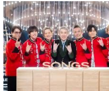
<NHK “SONGS” から、 中央が段田安則>

との呼びかけくらいには応える気持ちは持っていきたいと思うのですが 皆さまはどうお考えでしょうか。