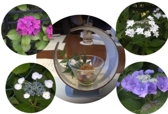
<散歩道に咲く紫陽花、中央の写真は無関係>