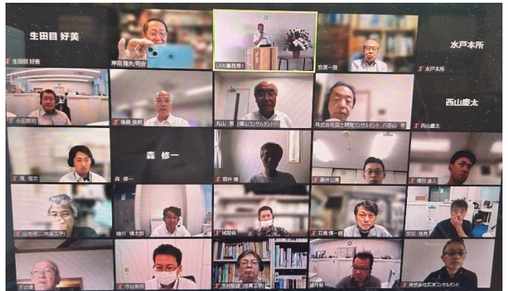
写真 セミナー終了時の映像