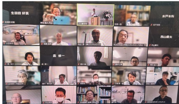
写真 セミナー終了時の映像